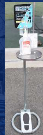
消毒用マテリアル